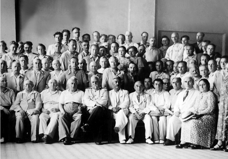
А.А. Чайка серед учасників 1-го з'їзду урологів України (1938 р.)

При лікуванні пухлин органів сечової системи А.А. Чайка відзначався значним радикалізмом. У свій час він відносився до поодиноких урологів, які вдавалися до екстирпації ураженого раком сечового міхура з пересадкою сечоводів у пряму кишку і до простатектомії з приводу раку передміхурової залози. Багато уваги приділяв він лікуванню хворих на аденому передміхурової залози («Клиника гіпертрофії простати», 1927, «Ближайшие результаты простатэктомии», 1930). Вперше у СРСР А.А. Чайка розробив техніку везикулектомії.