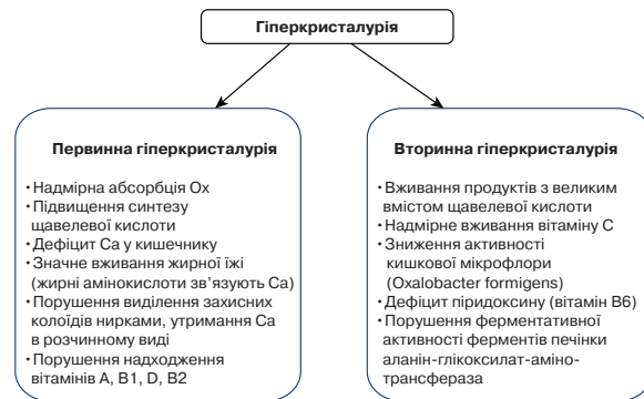
Мал. 2. Причинно-наслідковий зв'язок у формуванні кальцій-оксалатного нефролітіазу

З проведенням визначення рівня кальцію в крові і сечі при вираженій гіперкальціємії діагностують резорбтивну