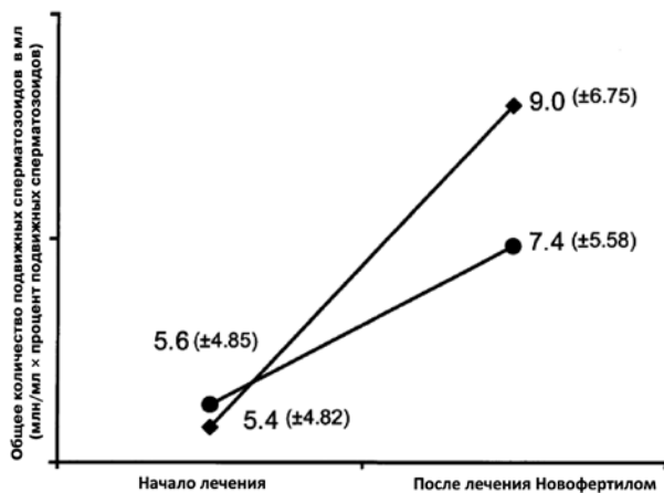
Рис. 1. Диаграмма изменения (Δ) абсолютного показателя общей подвижности сперматозоидов в мл с начала исследования до конца терапии Новофертилом (квадратики) или базовой терапией (кружочки). Показатели являются средними ± СО (р=0,008)

Ни при анализе 172, ни при анализе 162 контрольных показателей не было выявлено достоверной разницы в отношении объема спермы, скорости сперматозоидов (КАС), концентрации α-гликозидазы, ПОЛ в сперме, показателя морфологии