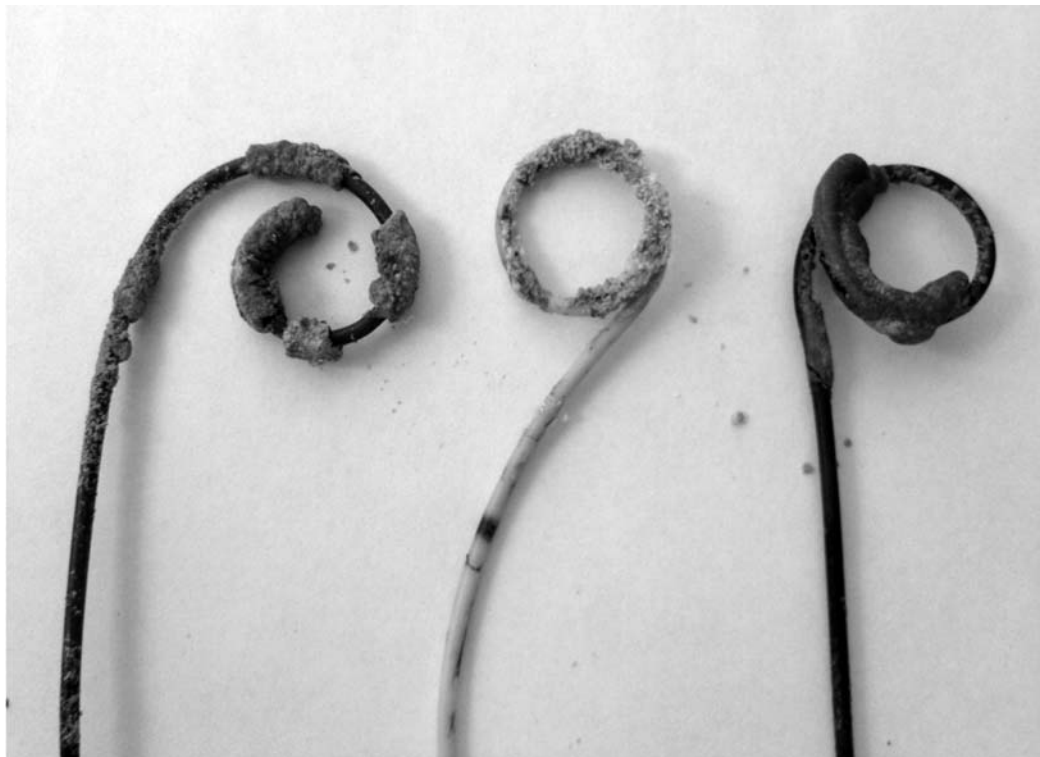
Стенти, інкрустовані солями

У хворих групи порівняння протягом першого місяця спостереження також не виявляли порушення функції дре-